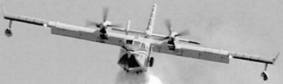
Incendio nei boschi intorno a Cefalù (Palermo)